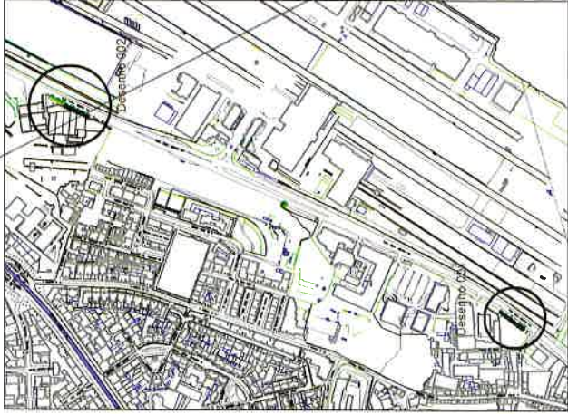
Planta Localização (extrato)