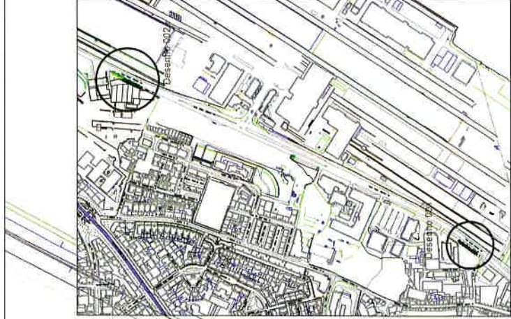
Planta Localização (extrato)