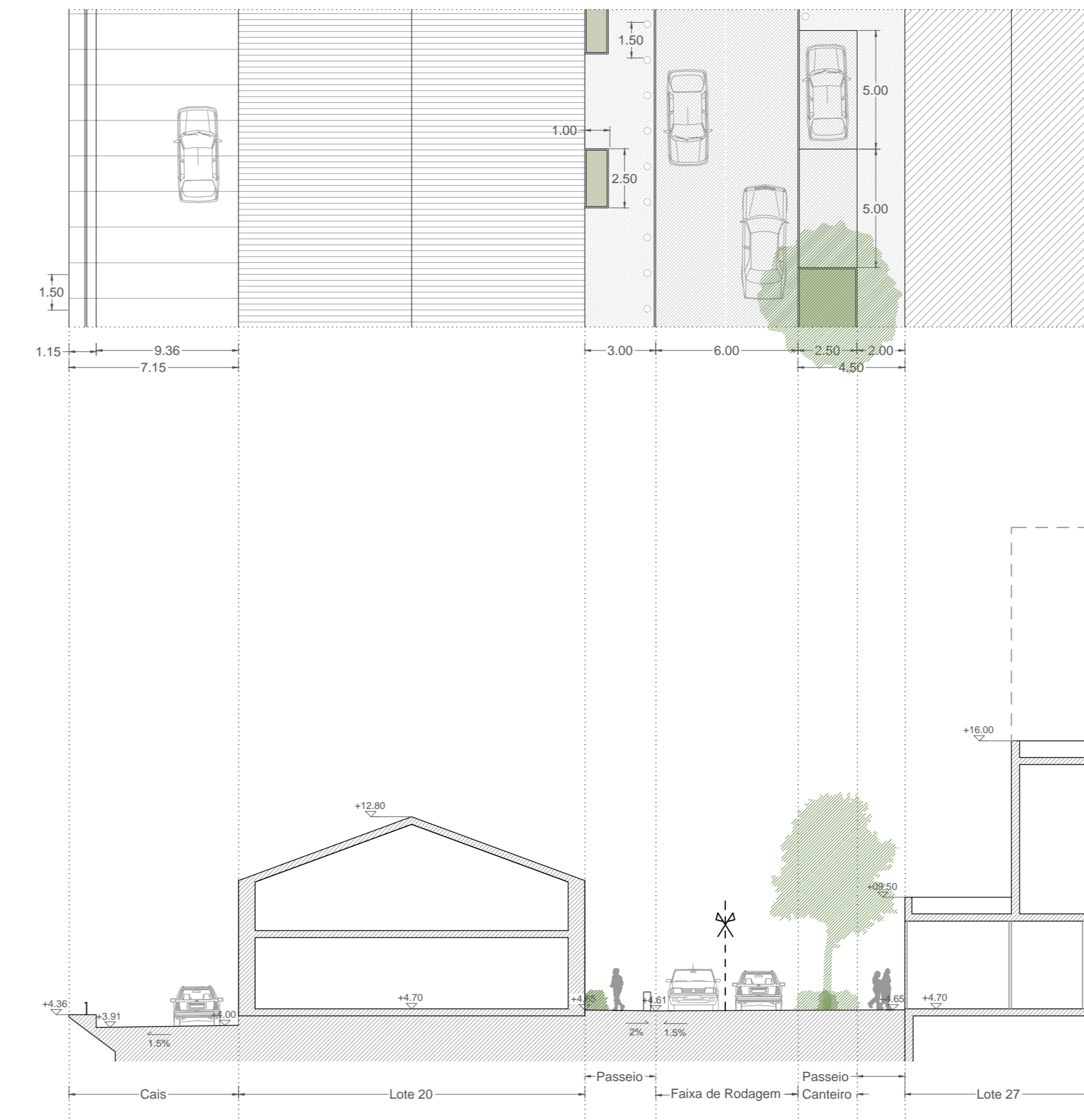
Perfil Transversal 3