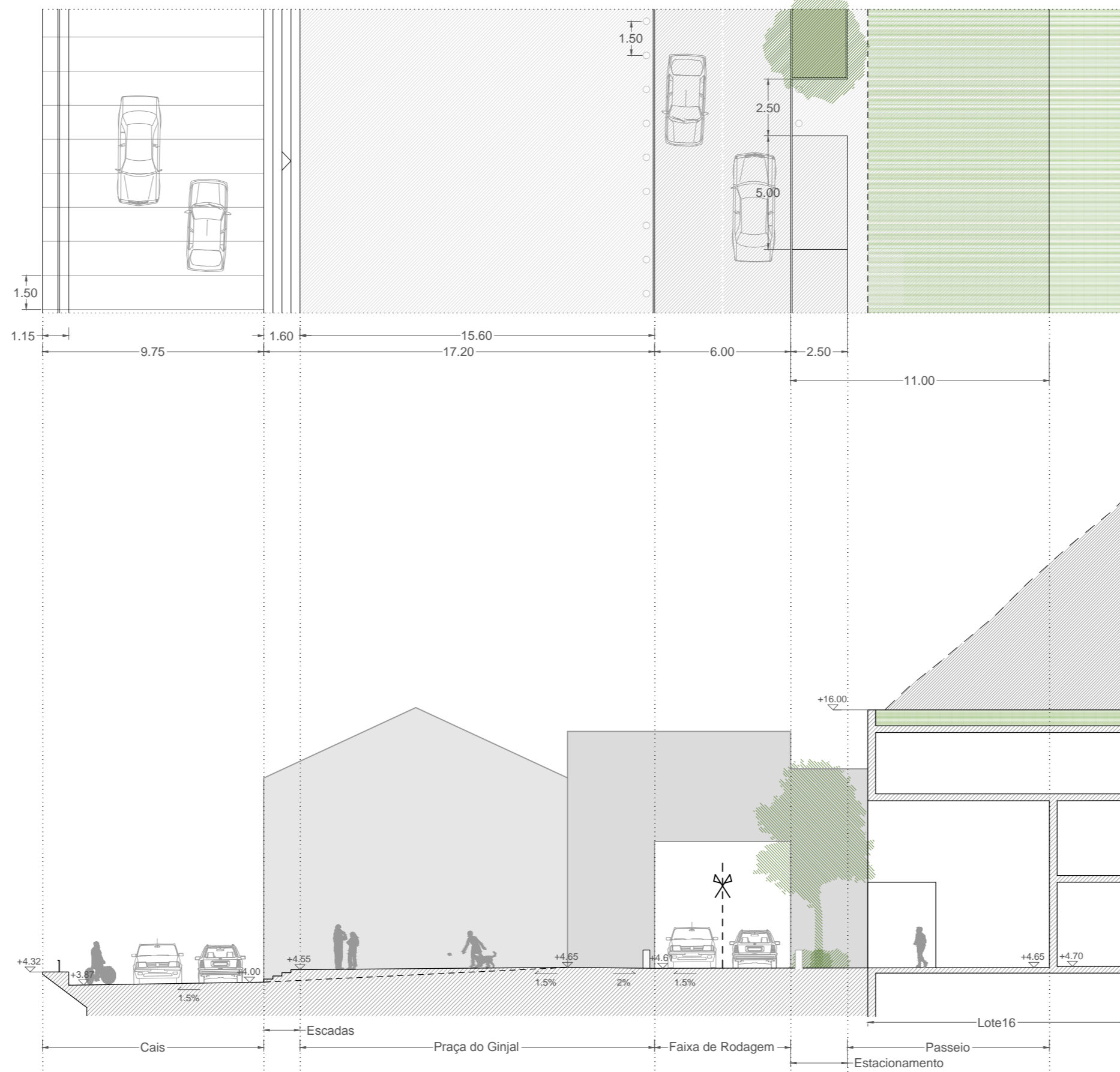
Perfil Transversal 2