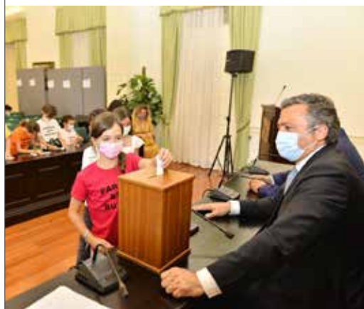
PRINCÍPIO 8 GOVERNANÇA E PARTICIPAÇÃO DOS CIDADÃOS. As crianças, adolescentes e jovens serão reconhecimentos como cidadãos do presente, com direito a participar na gestão e melhoria da vida comunitária, em igualdade de condições com os adultos, disponibilizando-se os canais e ferramentas adequados.

As ideias serão trabalhadas em vários contextos (turma e escola), até serem selecionadas as propostas finais de cada escola. Na última fase, as mesmas serão apresentadas e votadas, contando com a presença das equipas representantes de todas as escolas envolvidas e do Executivo Municipal, onde serão apuradas as 5 ideias finalistas. No ano letivo 2022/23, o projeto já se encontra na sua 4ª edição. Até ao momento, foram envolvidas 13 escolas do 1º CEB, num total de 1349 alunos e 52 turmas. ■